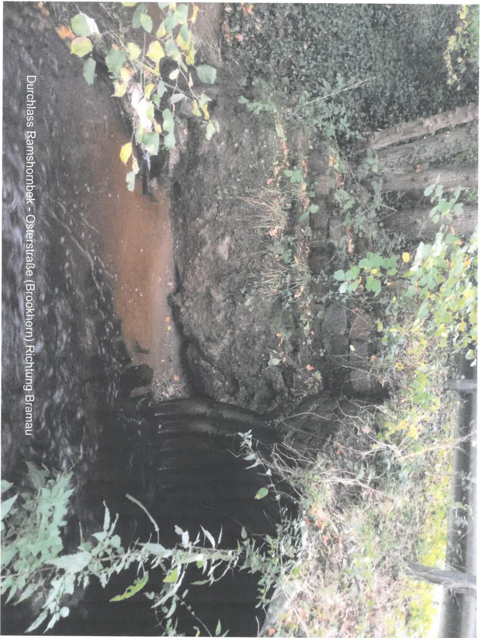
Durchlass Ramshornbek - Osterstraße (Brookhorn) Richtung Bramau