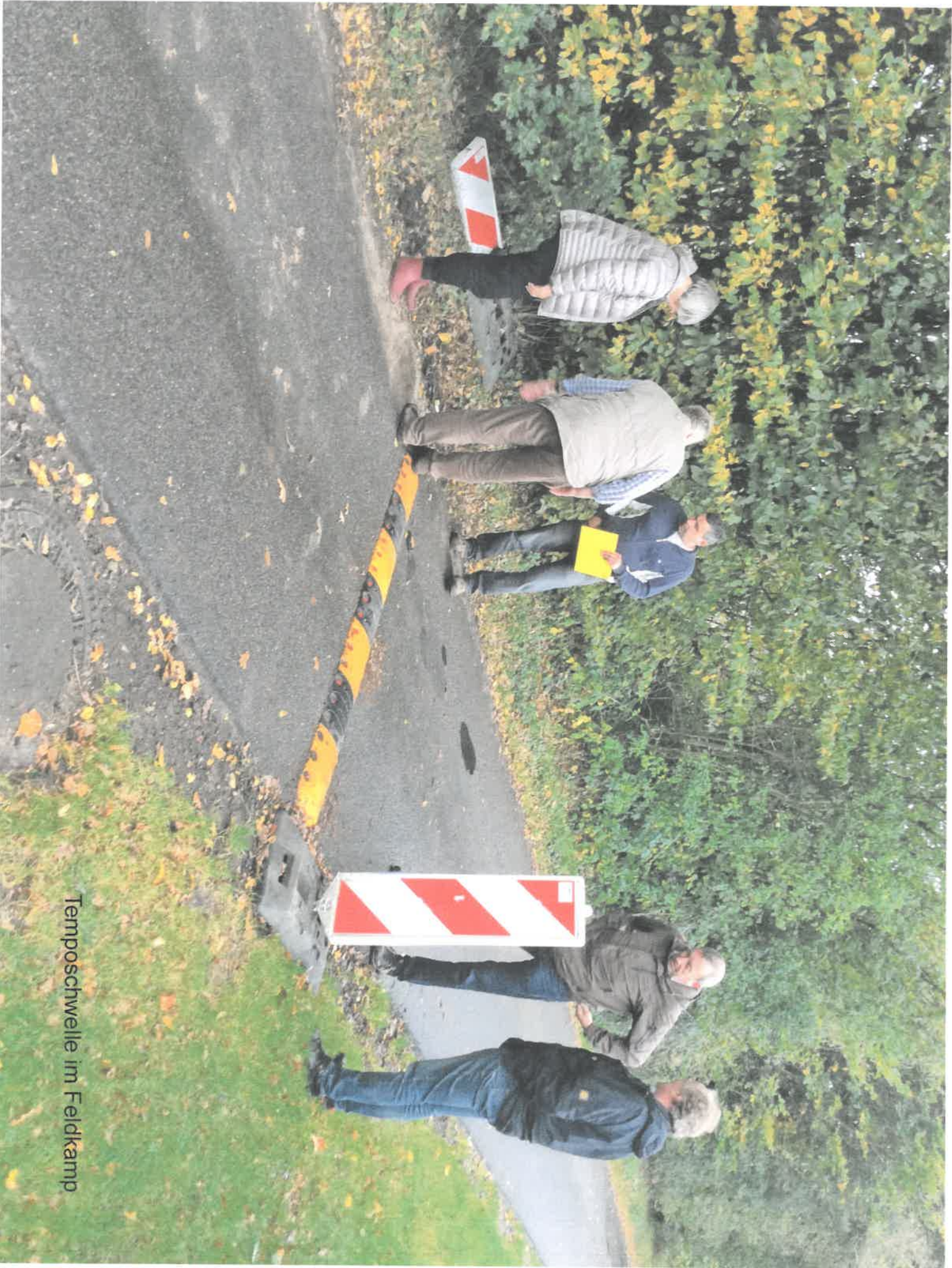
Temposchwelle im Feldkamp