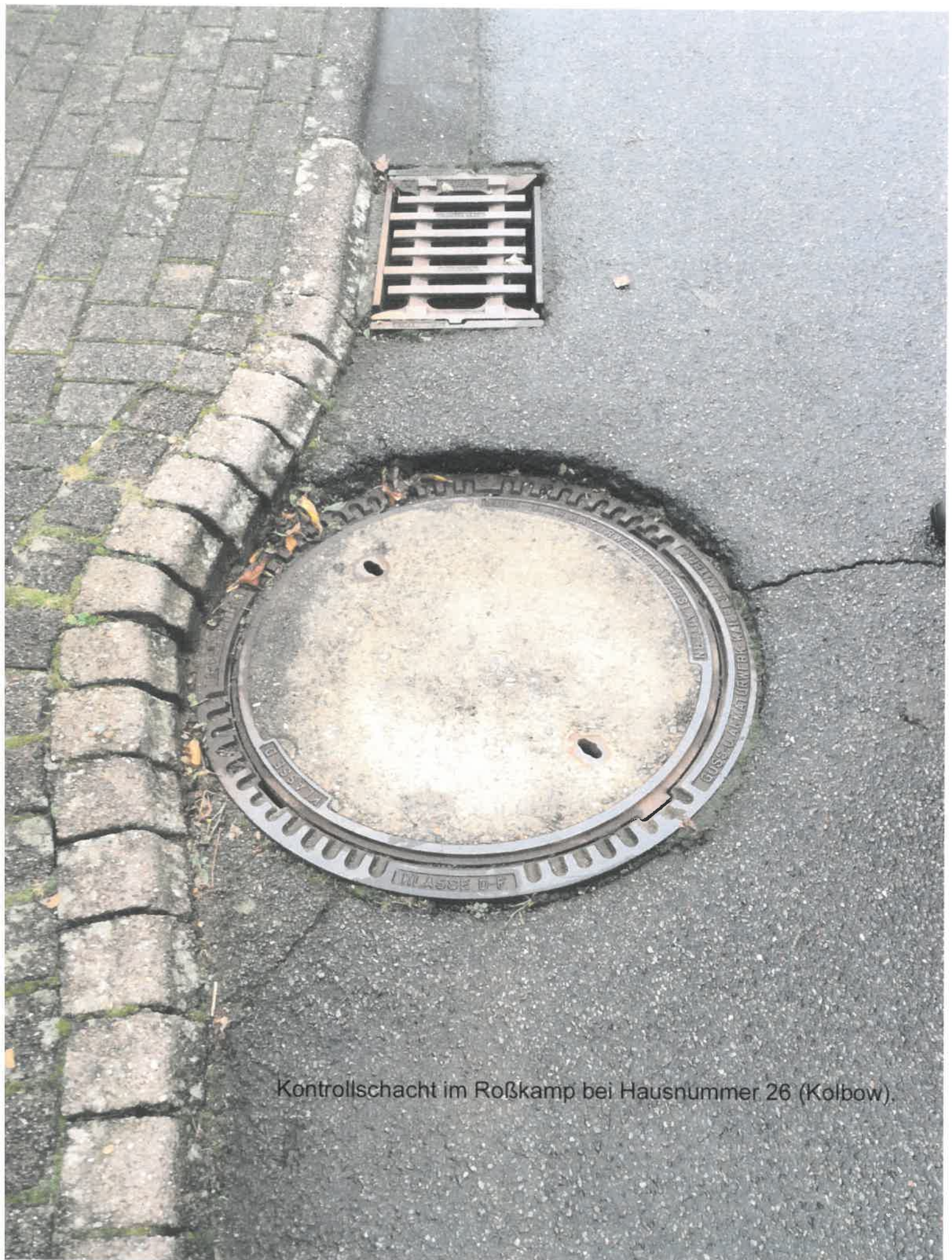
Kontrollschacht im Roßkamp bei Hausnummer 26 (Kolbow).